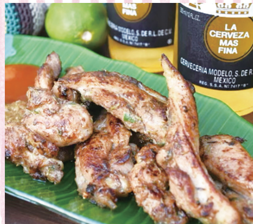
骨太有明鶏のジャークチキン 800円