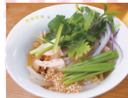
フォーガー (鶏と野菜のフォー) 880円