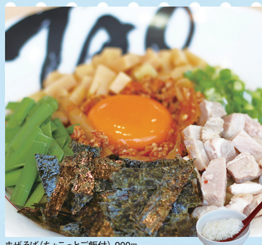
まぜそば(ちよこっとご飯付) 900円