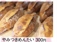
やみつきめんたい 300円

★好評につき9月末まで延長! 食パンフェア 【1/2】200円 【1本】400円