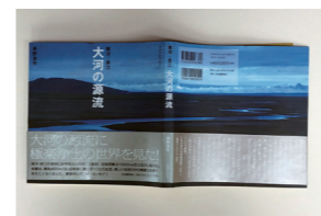
2009年発行「大河の源流 黄河・長江」(河出書房新社刊)

しかしながら、こんな雑描な文章を掲載させてもらえる「SECOND」に感謝している。