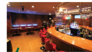
大庭オーナーの趣味 ゴルフ

創業42年。広い店内では、ボトルやグラスにもこだわり、お酒、カクテルを作るフレアバーテンディングのパフォーマンスも楽しめます。バー初心者におすすめのお店。