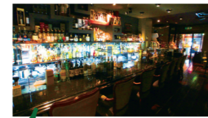
田中マスターの趣味 バスケ・スポーツ観戦

伝統的な技術を守りながら、新しい道具やお酒も取り入れて、常にチャレンジし続けているお店。新生姜を漬けた特製ウオッカで作るカクテルが人気。