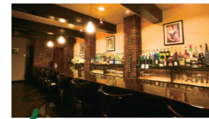
堤マスターの趣味 読書

創業24年。お酒や素材の相性とバランスを大事に作られる堤マスターのカクテルに、創業以来多くのファンが通います。文化街に静かに佇む隠れ家的バーです。