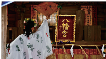
下庄八幡神社夏大祭「八朔祭」